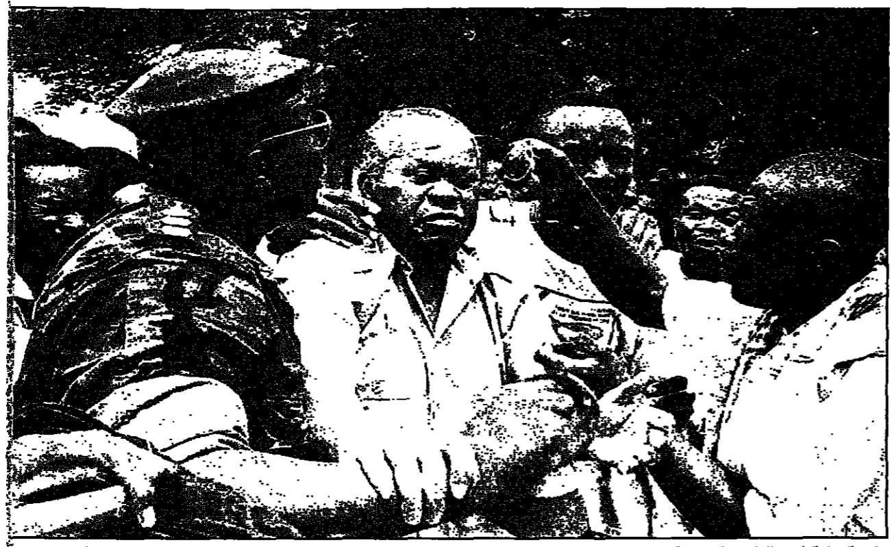
رئيس الوزراء الزائيري المخلوع أنطوان تشيكوبندي يتصدى لحالة جنسي حكومي اعتقاله عقب إصدار الرئيس موبوتو سبيكر اسم قرا بإقالته وتعيين الجنرال ليكوليا بولوتونغو

مباشرة بينهما استمر أربعة أيام في جنوب أفريقيا. وقال الرئيس موبوتو إن الاتفاق على وقف إطلاق النار هو خطوة مهمة نحو تحقيق السلام في رواندا. وأضاف أن الاتفاق يهدف إلى إنهاء العنف الذي طال أمسه منذ بداية الحرب الأهلية.